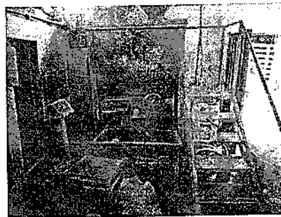
Fotografía No. 2 Mezcladora con cargue manual.