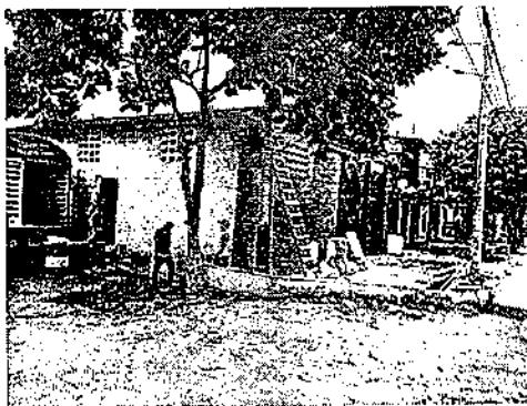
Fotografía No. 1 Fachada principal de la fábrica de producción de pegantes para cerámica

La actividad productiva de la empresa es la producción, empaqueo, y almacenamiento de pegante para cerámica. Las materias primas utilizadas son: Arena, aditivo químico o pegante denominado “Meseloce”, Cemento gris y cemento Blanco.